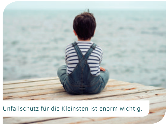
Unfallschutz für die Kleinsten ist enorm wichtig.

hohen Invaliditätssumme vorzuziehen ist, ist beim Gruppenvertrag leider nicht möglich. Sollten Sie daran Interesse haben, stehen Ihnen die Berater und Beraterinnen der BdV Verwaltungs GmbH (BVG) mit Rat und Tat zur Seite ( www.bdv-beratung.de ).