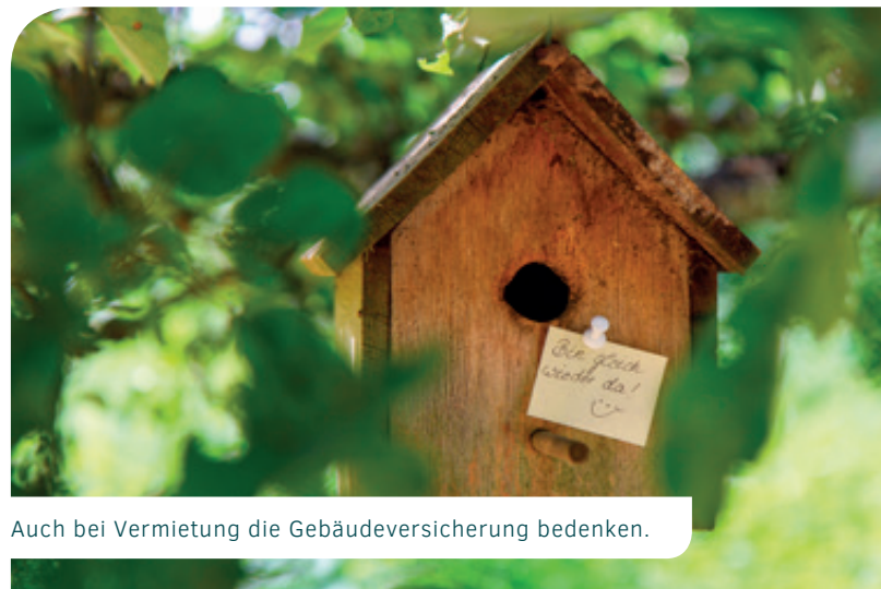
Auch bei Vermietung die Gebäudeversicherung bedenken.

Für Photovoltaikanlagen, deren Strom ins öffentliche Netz eingespeist wird, steht ein eigener Gruppenvertrag zur Verfügung. Über dessen Elektronikversicherung sind zusätzlich zum Versicherungsumfang der Wohngebäudeversicherung beispielsweise auch Schäden durch Marderbiss oder Diebstahl mitversichert. Ebenfalls enthalten ist eine Ertragsausfallversicherung, die einen vereinbarten Betrag leistet, wenn die Anlage aufgrund eines Schadenfalles keinen Strom mehr einspeisen kann. Auch ist eine Betreiber-Haftpflichtversicherung vereinbart, die beispielsweise einspringt, wenn durch das Einspeisen von Strom ein Schaden am öffentlichen Netz entsteht.